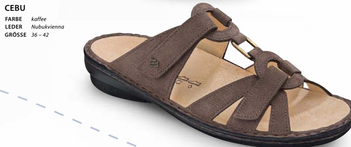
CEBU FARBE kaffee LEDER Nubukvienna GRÖSSE 36 - 42