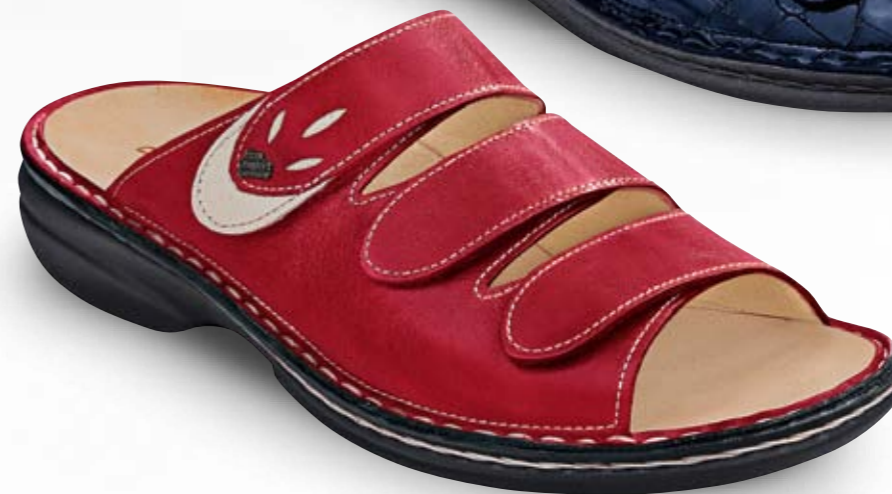
KOS FARBE red/jasmin LEDER Light/Okapi GRÖSSE 36 - 42