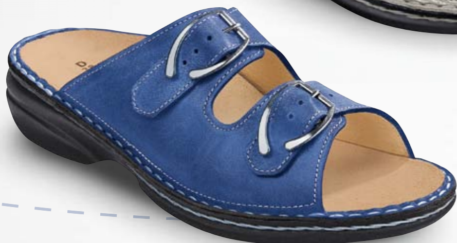
CUBA FARBE cobalt LEDER Sultan GRÖSSE 36 - 42