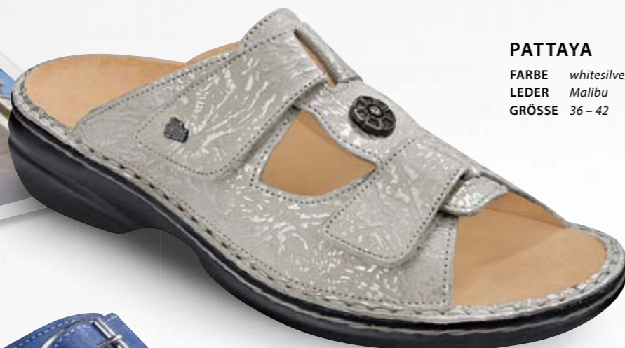
PATTAYA FARBE whitesilver LEDER Malibu GRÖSSE 36 - 42