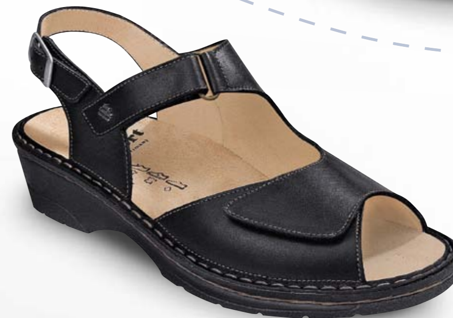
SABA FARBE schwarz LEDER NappaSeda GRÖSSE 3 - 8