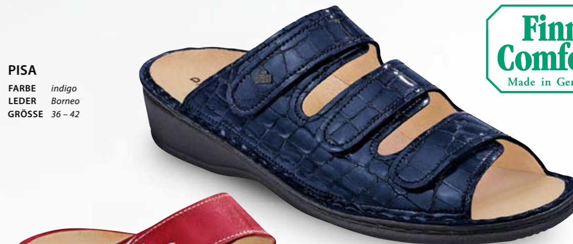
PISA FARBE indigo LEDER Borneo GRÖSSE 36 - 42